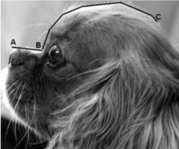
Abb. 2 Verhältnis Schnauzen-/Schädel­länge (aus Packer, 2014: S. 18)

Schnauzenlänge (Nasenspiegel bis Stopp) in mm X 100 = Schädel­länge (Stopp bis Kante Hinterkopf) in mm